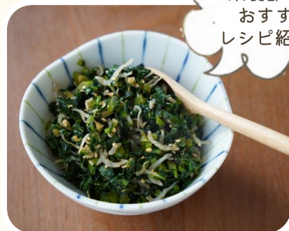
小松菜のちりめん じゃこふりかけ

小松菜を細かく切りフライパンにごま油、ちりめんじゃこ、切った小松菜を入れ炒め、醤油、白ごま、鰹節を入れ混ぜ合わせるだけです。 小松菜に含まれるβ-カロテンは油を使った料理で吸収率がよくなります。朝食やお弁当のお供には是非作ってみてください！